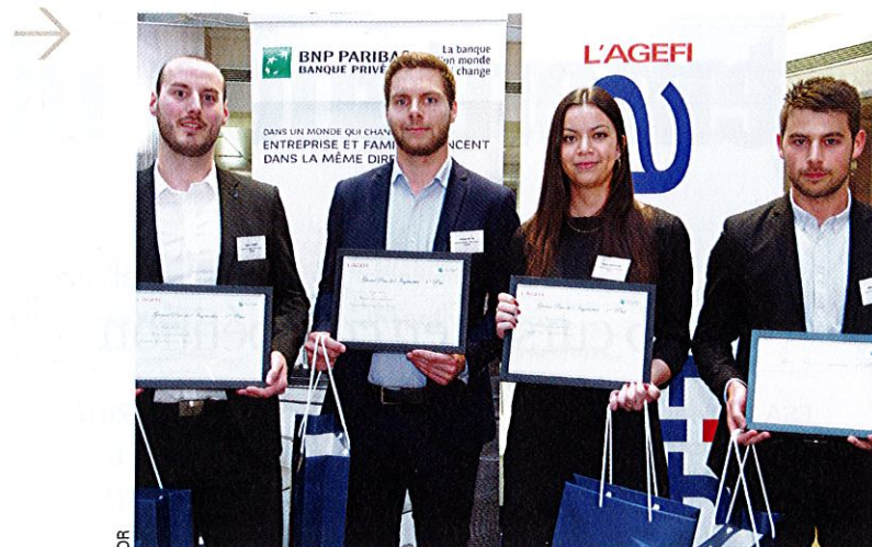
L'Esemap Angers brille et remporte le prix de l'Ingénierie.