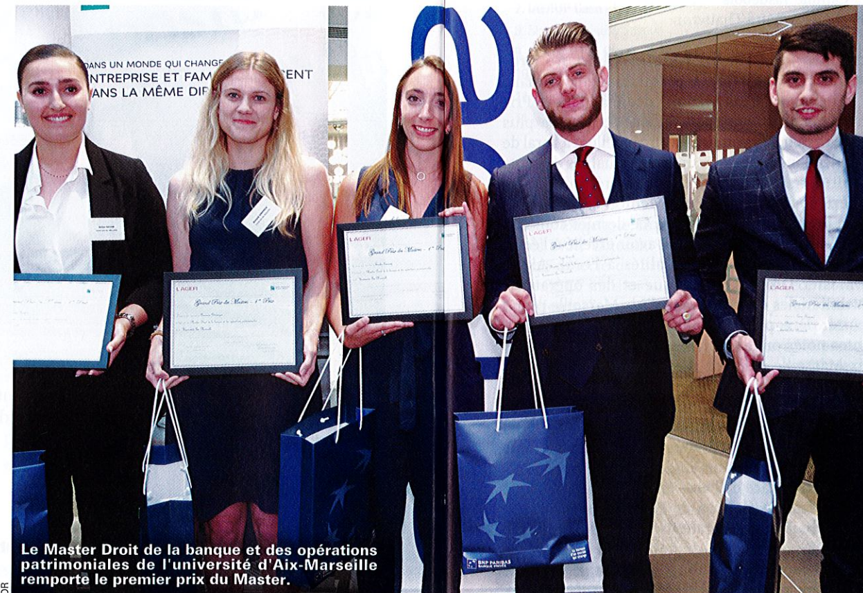
Le Master Droit de la banque et des opérations patrimoniales de l'université d'Aix-Marseille remporté le premier prix du Master.

province via les équipes de BNP Paribas Banque Privée. Concrètement, elle permet de juger les étudiants à partir d'un entretien de type découverte, afin de préciser les attentes familiales et financières du client exposées dans le cas pratique (voir page 20).